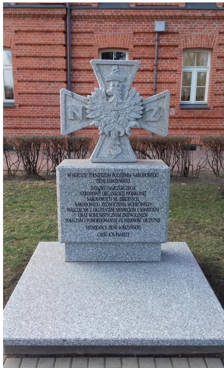
POMNIK ŻOŁNIERZY NARODOWYCH SIŁ ZBROJNYCH W ŁOMŻY