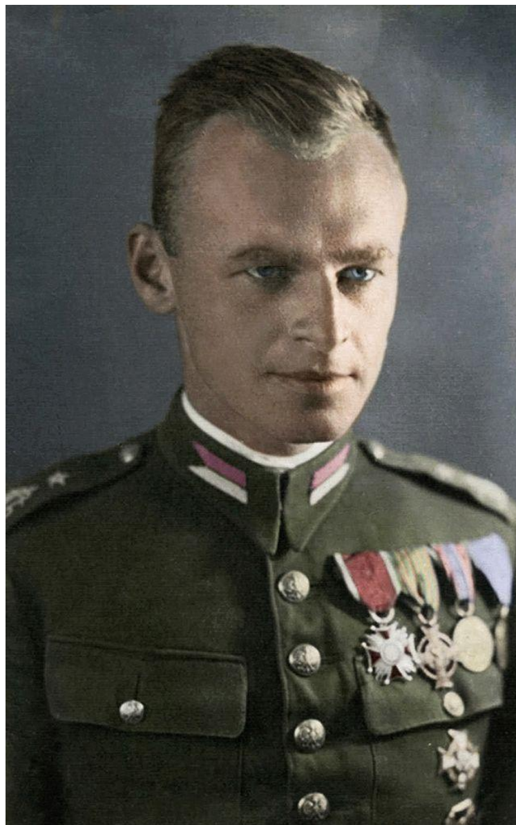
Rtm. Witold Pilecki- więzień Auschwitz, autor słynnego „Raportu” uczestnik Powstania Warszawskiego, zamordowany w 1948r. w więzieniu na Mokotwie