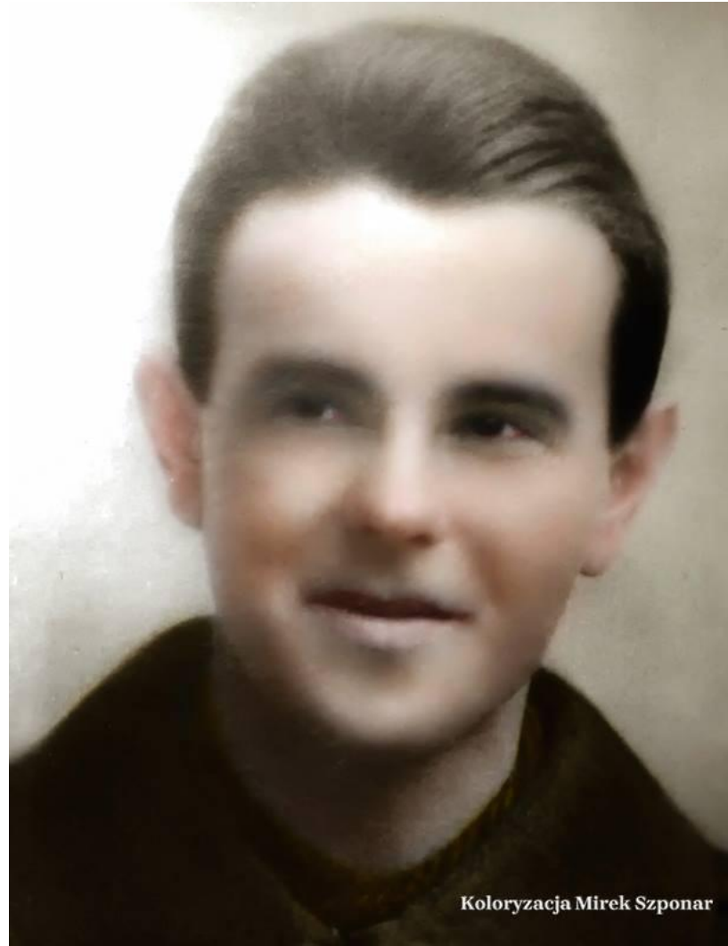
Mjr. Hieronim Dekutowski „Zapora”. Żołnierz Polskich Sił Zbrojnych, „cichociemny”, dowódca oddziałów partyzanckich AK, DSZ i Zrzeszenia WiN, harcerz. Wyrokiem Wojskowego Sądu Rejonowego w Warszawie na 7 krotną karę śmierci. Stracony 7 marca 1949 r.