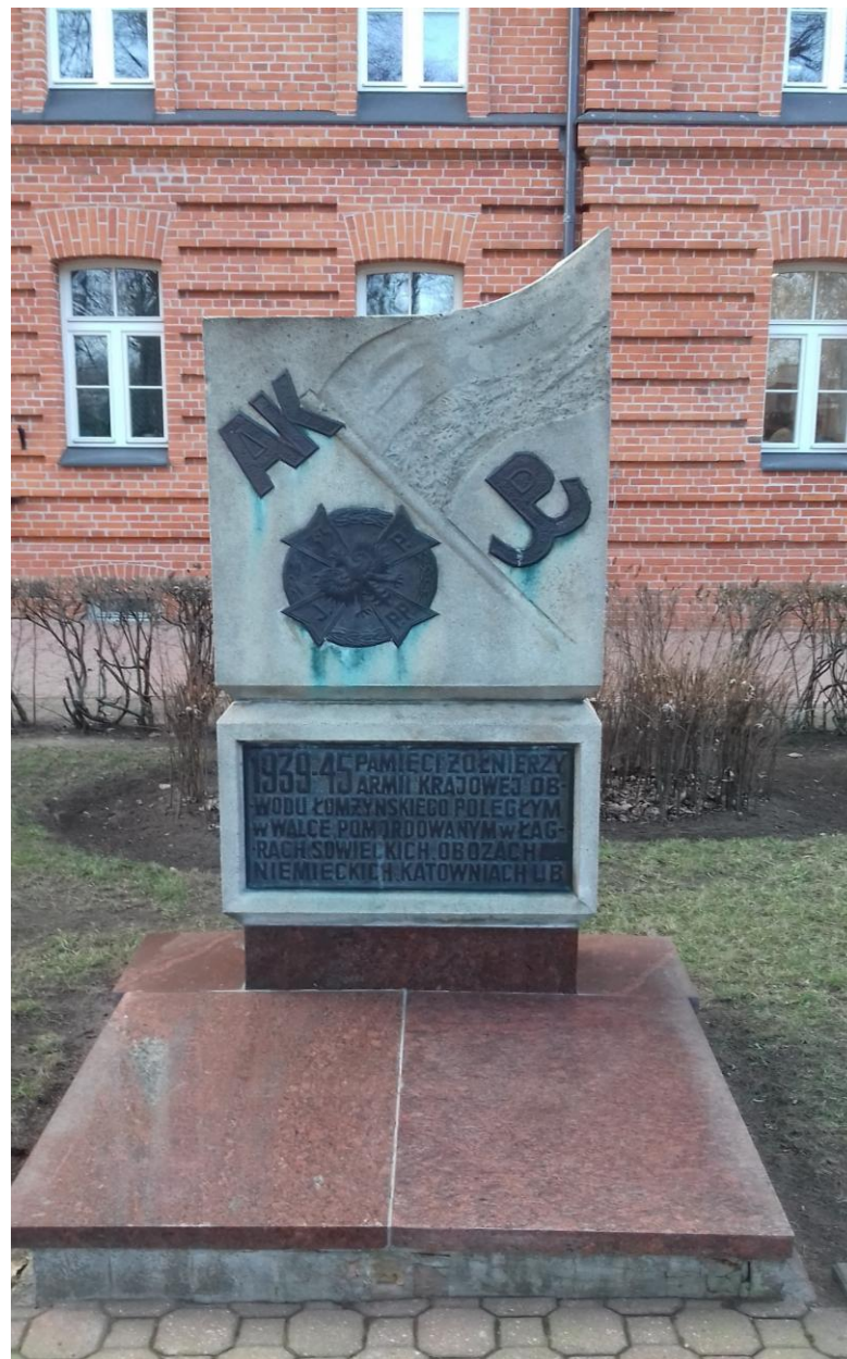
POMNIK ŻOŁNIERZY ARMII KRAJOWEJ W ŁOMŻY