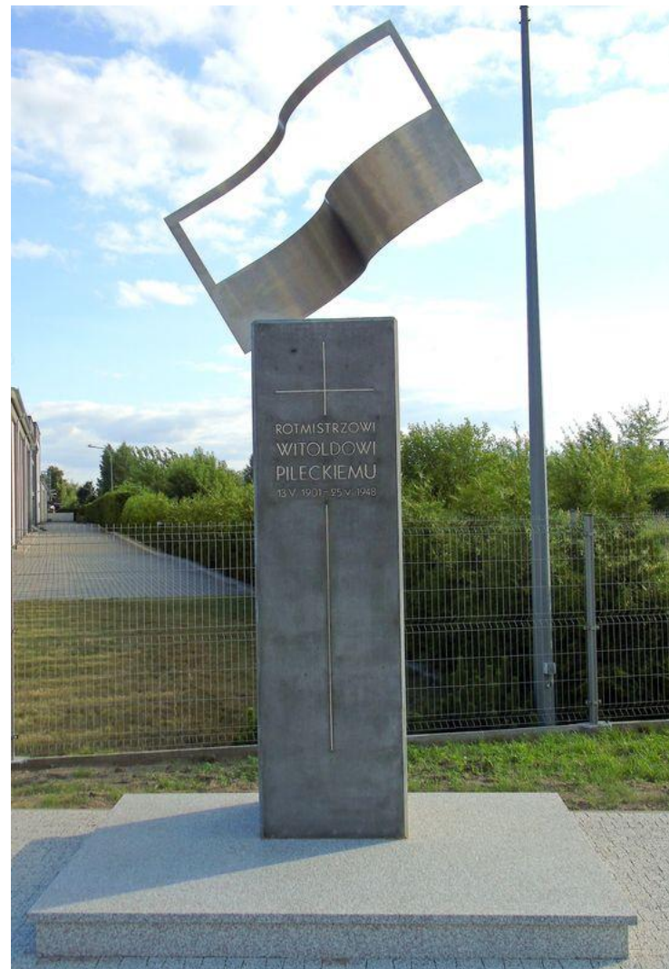
POMNIK ROTMISTRZA PILECKIEGO W ŁOMŻY