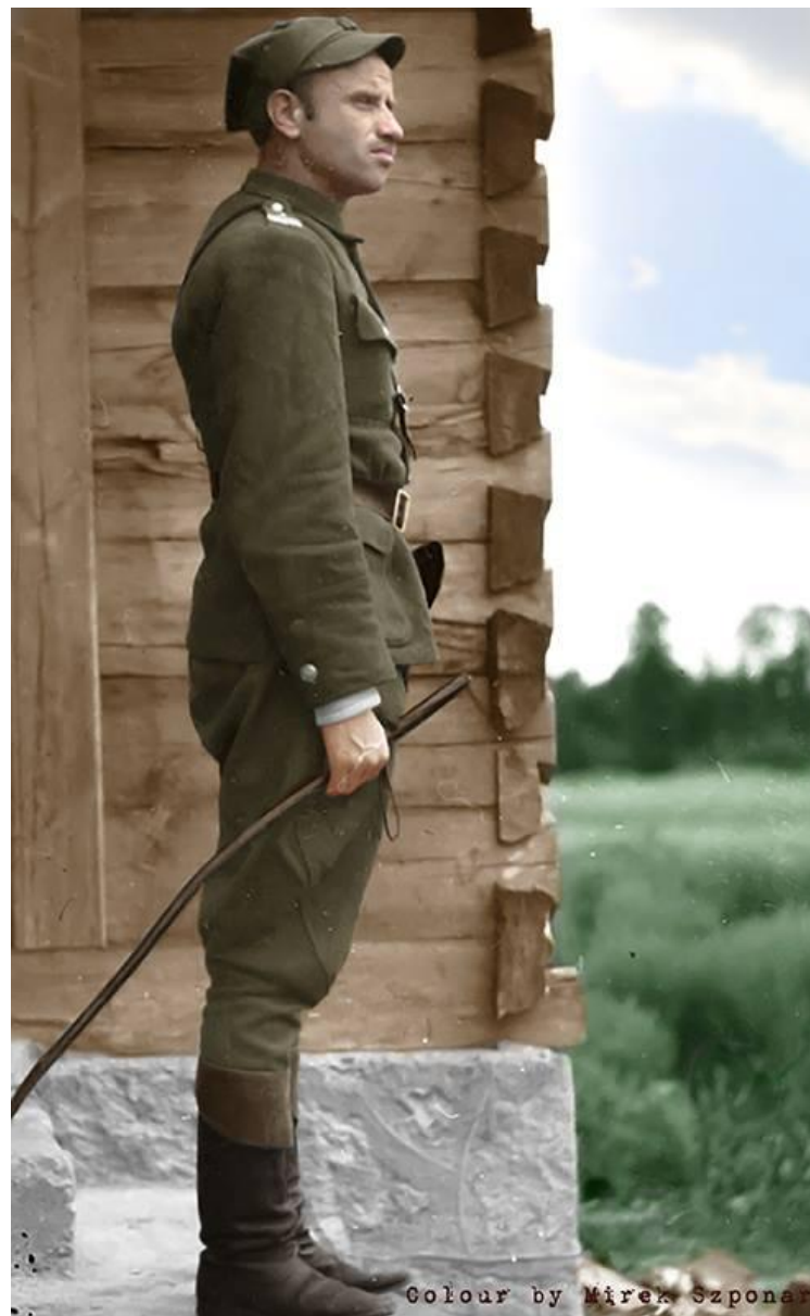
Mjr. Zygmunt Szendzielarz legendarny dowódca partyzancki „Łupaszka”.