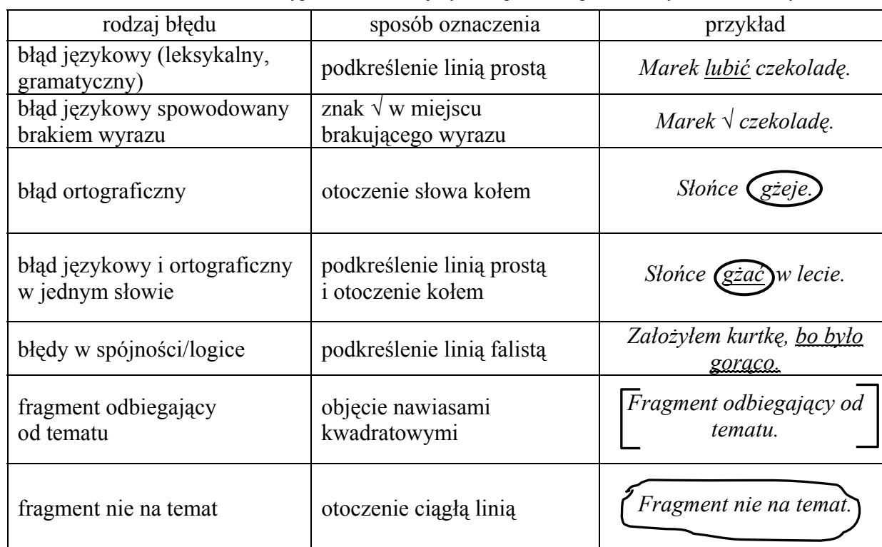
TABELA 4. Oznaczanie błędów w wypowiedziach zdających na poziomie podstawowym i rozszerzonym

Błędy oznaczane są w tekście z wykorzystaniem oznaczeń podanych w Tabeli 4.